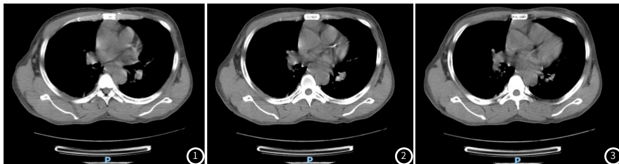
图1~3 CT图可见胸廓两侧对称,气管居中,纵隔无移位。两肺纹理增粗,小叶间隔增厚,可见多发粟粒状小结节影。右肺下叶见条纹状高密度影;管-支气管通畅;两肺门影未见明显增大,两侧胸膜稍增厚;两侧胸腔内见少量积液影;纵隔内未见明显肿大淋巴结。前纵隔可见小片状软组织密度影,与心包关系密切。心包稍增大。冠状动脉走行区可见钙化灶。扫及腹腔内见积液影。

1.4 观察指标 (1)不同钙化情况MHD患者的基础资料对比;(2)不同钙化情况MHD患者的血脂、血压对比;(3)不同钙化情况MHD患者的血清指标对比;(4)不同钙化情况MHD患者的CACS、AACS对比;(5)MHD患者CAC情况的多因素Logistic回归分析。